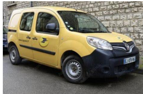
日本でよく見かけるRenault のKangooはフランスでは郵便局の配達車