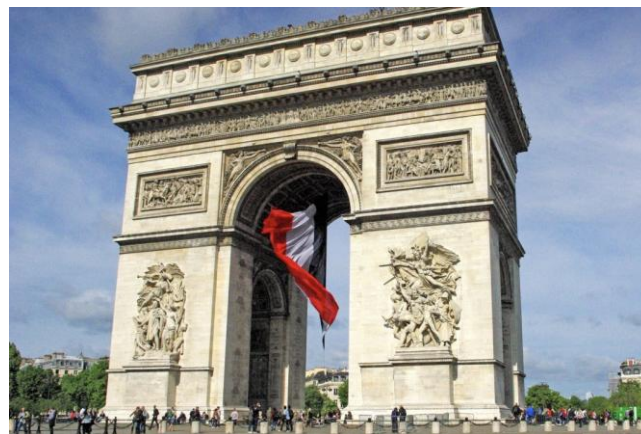
5月8日「戦勝記念日」 にフランスの国旗

パリ出身で、今は茨城県内に住んでいます。日本は20年以上になります。日本での生活が長いフランス人から見たフランスの話をしたいと思います。よろしくお願ひします。