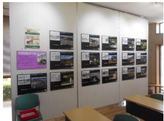
パネル展示の様子(水戸市立内原図書館にて)